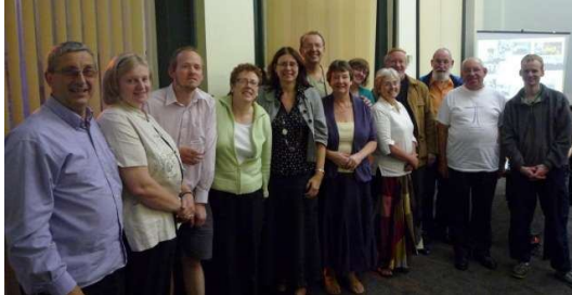
Des représentants de 13 églises et ministères rassemblés dans le centre municipal de Leeds, pour prier

revue locale et d'autres revues d'affaires telles que chambre de commerce, etc. Nous devrions créer un comité de travail représentant les chapitres locaux. '